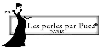
Schéma pendentif « Kali » 2020 par PUCA®