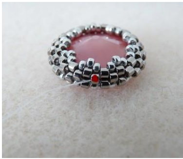
16) Venir se placer au 2 e rang de DB11 (centre)