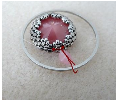
17) Placer 1 Pinch, passer sous l'anneau puis passer à nouveau dans la Pinch et le DB11 suivant