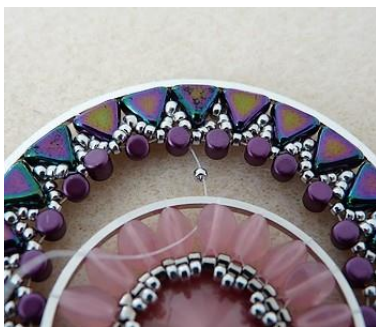
19) Assemblage des 2 cercles : depuis la Minos placer 1 R15 et passer sous le cercle avec les Pinch