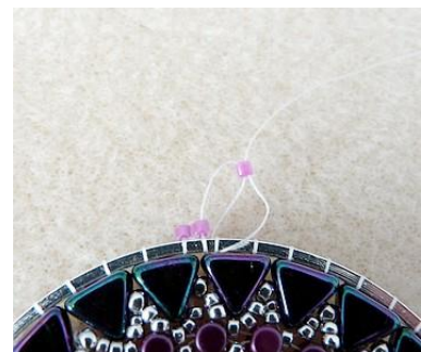
24) Placer 1 DB11, passer sous le cercle et remonter dans le DB11. Faire tout le rang ainsi 😊