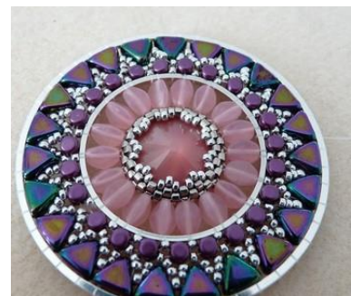
21) On obtient ceci 😊 Vous pouvez terminer comme ceci ou continuer en ajoutant un rang de Brick Stitch