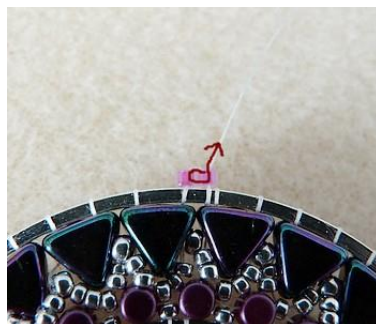
23) Passer à nouveau dans les 2 DB11