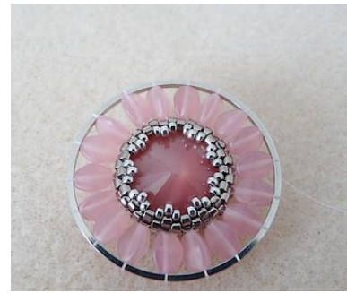
18) Placer 18 Pinch