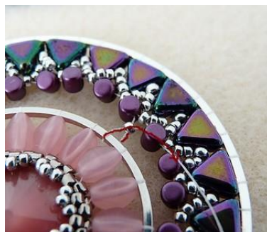
20) Passer à nouveau dans la R15 puis dans la Minos suivante. Faire tout le rang ainsi 😊