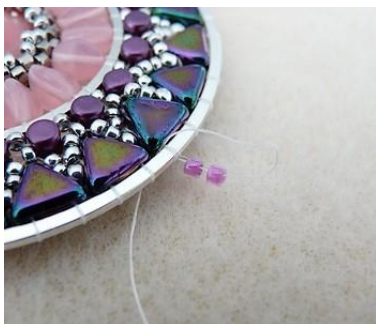
22) Placer 2 DB11 autour du cercle