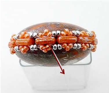
10) On obtient ceci 😊 On se place ICI