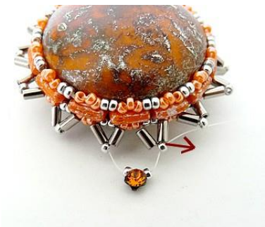
13) Placer 1 R15, 1 SM (trou du haut) 1 R15 entre les R15 centrales