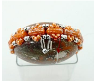
11) Placer 1 B, 1R15, 1 B et se placer dans les trois R15