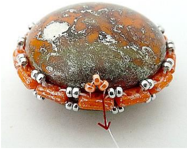
7) Placer 3 R 15 dans la Piros