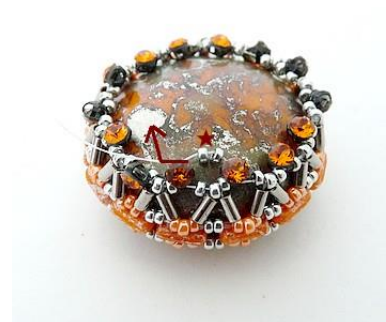
15) Placer 2 R15 entre les SM tout le rang