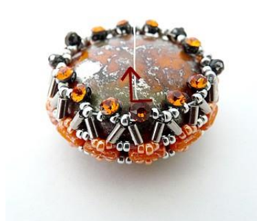
14) Serrer et se placer dans le haut du SM