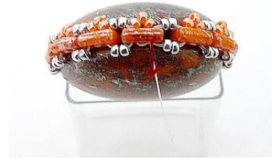
9) Continuer les étapes 7 et 8 tout le rang ainsi que l'autre côté