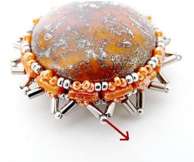
12) Faire tout le rang ainsi et se placer dans la R15 centrale